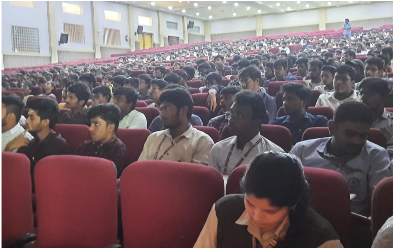
Students of I & II CSE and its Allied Branches attending the Awareness Program